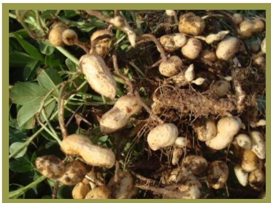
Foto 1– Tomada el día 23/03/2012 en Mercedes - San Luis

Las lluvias de la última parte del ciclo (Marzo y Abril 2012) permitieron recuperar en parte el estado general de los cultivos, lo que hoy se materializa en una leve mejora en el rendimiento promedio provincial estimado el mes anterior.