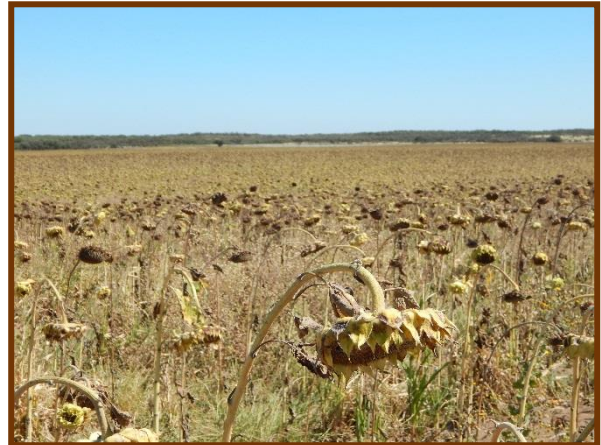
Foto tomada el 20/03/2018 a 3.4 Km al Sudeste de Batavia, depto. Gob. Dupuy

Maíz. Estado fenológico R2 (Cuaje). Estado general Regular. No se observó la presencia de plagas ni enfermedades, pero si signos de estrés hídrico y daños por granizo.