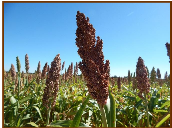
Foto tomada el 20/03/2018 a 1.1 Km al Norte de Bagual, depto. Gob. Dupuy

Girasol. Estado fenológico R9 (Madurez fisiológica). Estado general Bueno. No se observó la presencia de plagas y enfermedades.