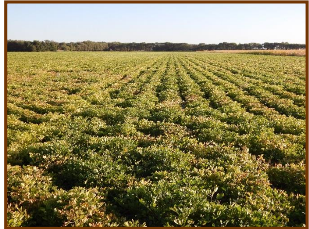
Foto tomada el 20/03/2018 a 5 Km al Sur de Villa Mercedes, depto. Gral. Pedernera

Sorgo. Estado fenológico Estado 7 (Grano lechoso). Estado general Muy Bueno. No se observó la presencia de plagas y enfermedades.