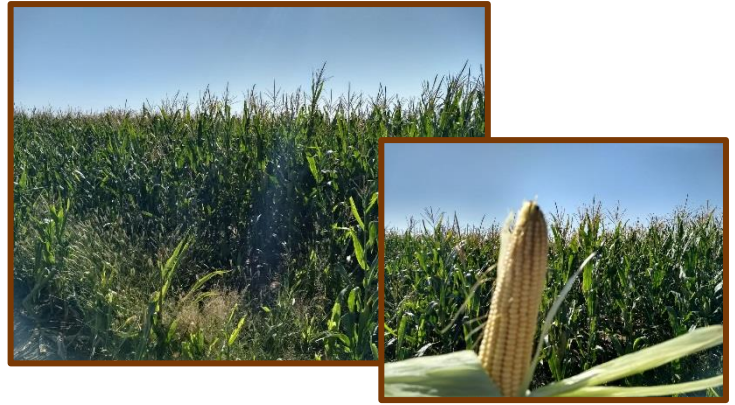
Foto tomada el 19/03/2018 a 4 Km al Norte de Candelaria, depto. Ayacucho

Soja. Estado fenológico R5 (Comienzo de llenado de semilla en nudo). Estado general Muy bueno. Cultivo bajo riego. No se observó la presencia de plagas y enfermedades.