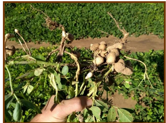
Foto tomada el 19/03/2018 a 11 Km al Sudoeste de Candelaria, depto. Ayacucho

Sorgo. Estado fenológico Estado 8 (grano pastoso). Estado general muy bueno. No se observaron plagas ni enfermedades.