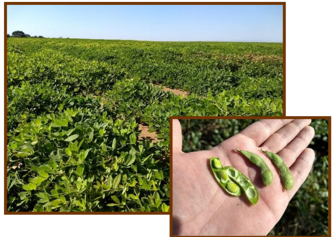
Foto tomada el 19/03/2018 a 4 Km al Norte de Candelaria, depto. Ayacucho

Maní. Fenología: R6 (semilla completa). Estado general Muy bueno. Cultivo bajo riego. No se observó la presencia de plagas, pero sí viruela ( Cercospora arachidicola Hori y Cercosporidium personatum ).