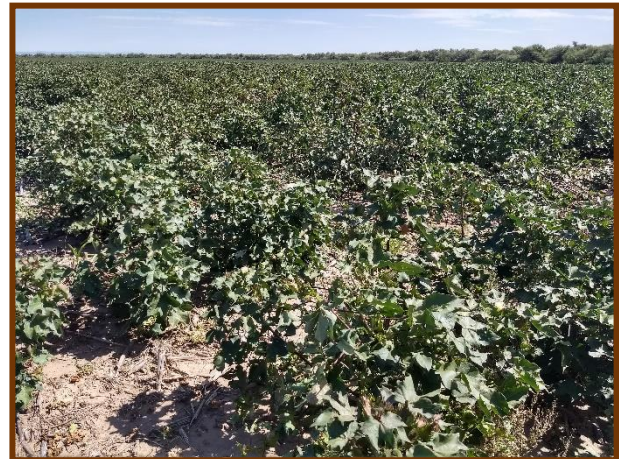
Foto tomada el 19/03/2018 a 15 km al Nor-Oeste de Lafinur, depto. Junin

Algodón. Estado fenológico M1 (1er cápsula abierta de la Escala de Poisson J. A.) Estado general Bueno. No se observó la presencia de plagas ni enfermedades.